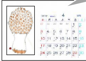
④ポストカード型-横(A4)