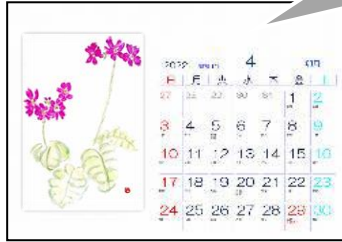
④ポストカード型-横(A4)