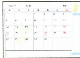
⑧スケジュール帳(B6/A6) 500円